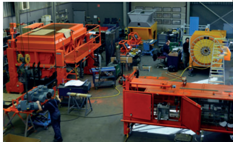
Fig. 2: Equipo Concore en la nave de montaje de Van De Weert

Concore fue fundada en 2010, partiendo de sus dos predecesores, X-TEC Oy Ltd y Thiso B.V. Su innovador concepto de extrusora, que comprende un accionamiento individual sinfín, compactación perfeccionada, desgaste reducido y un diseño que enfatiza la seguridad y salud laboral, ha sido una tecnología muy apreciada entre los usuarios. Concore también proporciona servicio y supervisión a nivel mundial gracias al nuevo sistema de servicio a distancia, que permite a los expertos de Concore comprobar y ajustar los parámetros y ofrecer soporte directamente a los clientes. Las máquinas Concore se pueden conectar a gran cantidad de software.