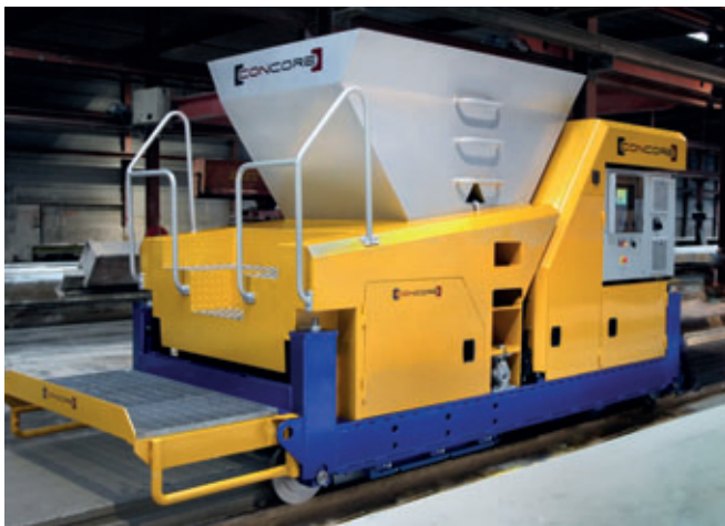
Fig. 1: Extrusora estándar Concore

Concore B.V., un experto en la extrusión de placas alveolares y maquinaria de alto rendimiento, con amplia experiencia en el suministro de fábricas completas de prefabricación, está uniendo fuerzas con su homólogo en la industria, la empresa Machinefabriek Van De Weert Helmond b.v. Juntos introducirán un nivel superior de tecnología al mercado de los prefabricados, contando con el apoyo de ingenieros cualificados, trabajadores con experiencia y excelentes instalaciones. Ambas empresas tienen su sede en los Países Bajos y combinarán desarrollo, ventas y esfuerzos de producción. Su ubicación central garantiza un fácil acceso a las piezas y a un mayor equipo de técnicos de servicio cualificados y experimentados.