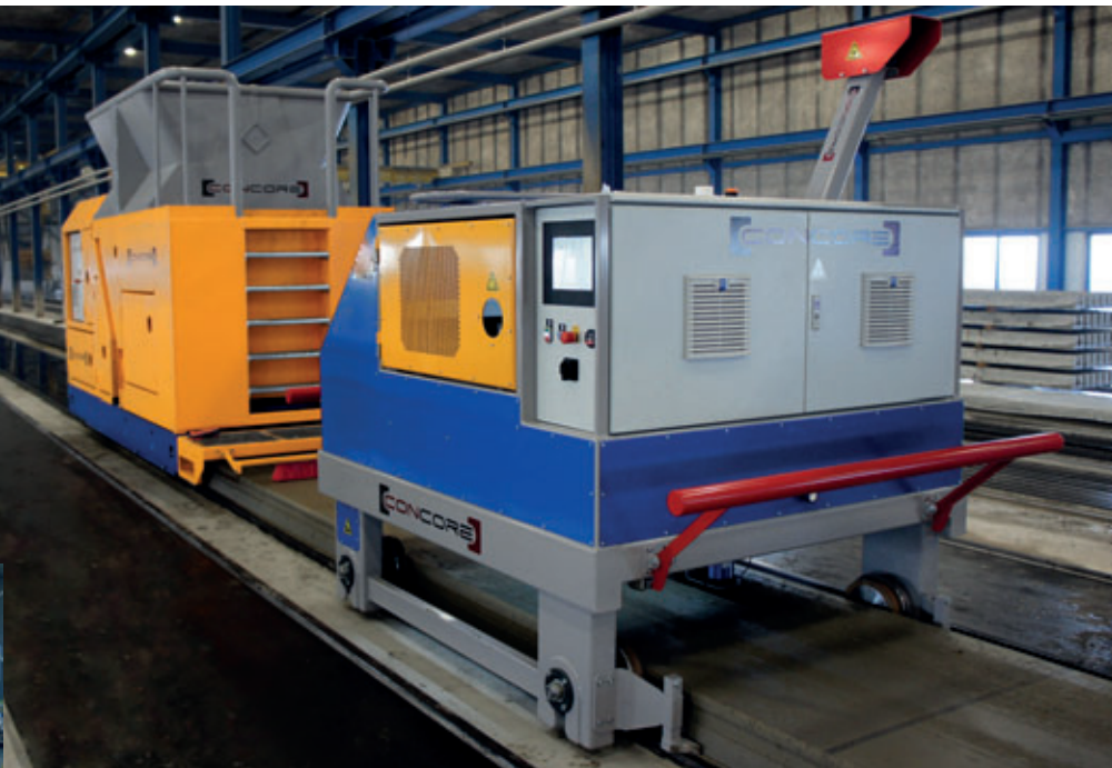
Fig. 3: Una entrega reciente de Concore a una fábrica de placas alveolares con 6 bancos en Bisofloor, Países Bajos. Concore modificó la extrusora para cumplir con las especificaciones del cliente.